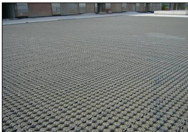
Fig. 1 Superficie coperta dagli elementi