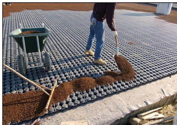
Fig. 2 Posa del lapillo vulcanico