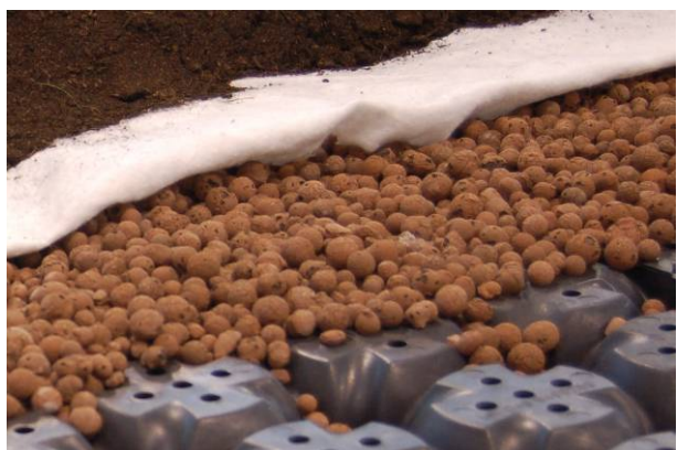
Fig. 3 Particolare del riempimento e del tessuto-non-tessuto filtrante di separazione