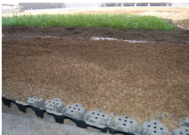
Fig. 3 Particolare stratigrafia