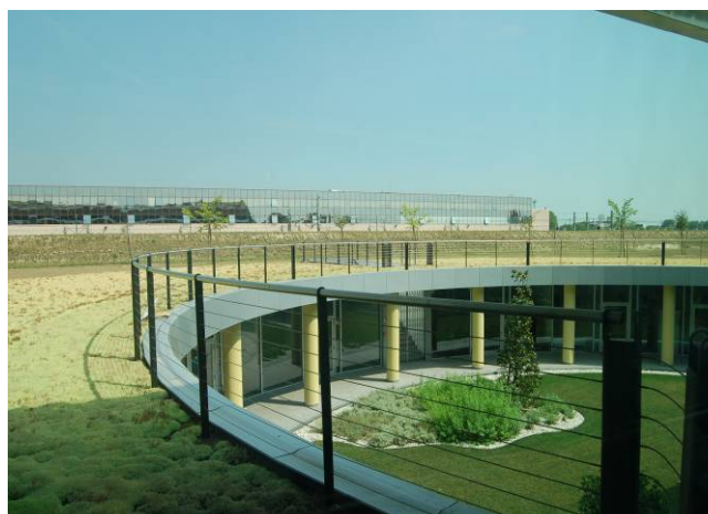
Fig. 4 Panoramica - lavori completati

Il giardino pensile è stato progettato per rendere il nosocomio un luogo più accogliente e confortevole. La presenza del verde, oltre ad avere un sicuro effetto mitigante per l'ambiente, favorisce il benessere dei degenti e di quanti operano all'interno della struttura.