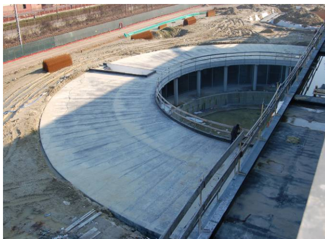
Fig. 1 Panoramica - inizio lavori